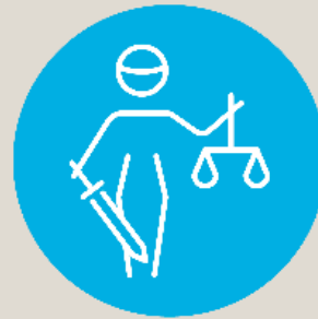
Enforcing consumer law