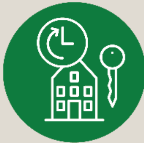
Construction law Renting law