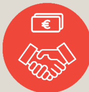
Conciliation and mediation in the EU